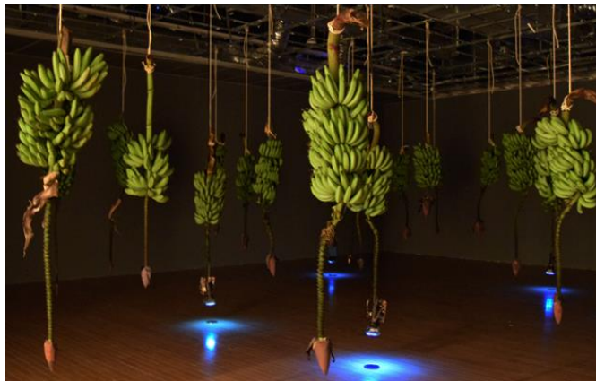
Figura 5. Musa híbrida , José Alejandro Restrepo (1996), video instalación.

un lado, y por el otro se colgaban pequeños proyectores con poca distancia desde el suelo donde se podían escuchar y ver las historias y documentaciones visuales de lo que fue un periodo de violencia que se desató alrededor de la zona más rica en producción de banano en la región del Urabá. Restrepo, a través de su exposición, plantea examinar unas connotaciones históricas y políticas que posee este fruto (que también se menciona y tiene una significación o connotación histórica asociada a la violencia a partir del asunto de la masacre de las bananeras en los años veinte), fruto asimilado en algunos casos como prohibido, o fruto del paraíso (reemplazando la manzana). La obra posee unas características temporales ya que su duración o la maduración del fruto puede cambiar dependiendo de su lugar de exposición, resaltando así la propiedad efímera que posee la pieza.