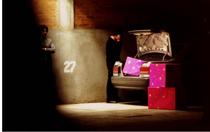
Figura 3. Cajas fucsias con estrellas brillantes, y Anexo 27 , Juan Fernando Herrán (1996) instalación. Extraído: Portafolio Juan Fernando Herrán, https://www.arte-sur.org/wp-content/uploads/2013/01/PORTA-GENERAL-SCREEN2.pdf

De igual manera, en 1997 Fernando Arias es invitado a INSITE 97, un proyecto cultural, artístico y curatorial de los años 90 en un contexto transnacional fronterizo (Tijuana y San Diego), un evento dedicado a la exploración de la presión política, social y económica que existe en la frontera entre México y EE.UU. La pieza presentada por el artista se tituló La línea y la mula , obra que hizo alusión a aquellas personas que usan sus cuerpos para transportar o contrabandear drogas, llamadas mulas 10 ingiriendo grandes cantidades de estupefacientes, que son guardados en sus estómagos. La obra de Arias hace énfasis no sólo en la frontera que traza una gran línea o muro, que divide ambos países por medio de una lámina metálica, sino que también pone debajo de ésta