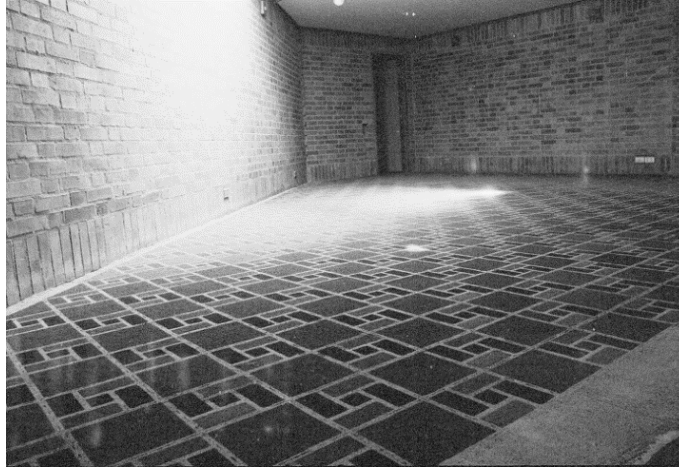
Figura 2. Grano , Miguel Ángel Rojas (1981), instalación.

Rojas se considera como el primer artista colombiano en cuestionar conscientemente una relación espacio temporal de los fenómenos o artefactos estéticos, y superar los límites académicos que dieron paso al lenguaje de la instalación como una posibilidad de generar un diálogo entre la obra y el espectador: “Toda obra plástica es susceptible de derivar hacia la instalación; eso sucede cuando no se limita a situarse en un lugar, sino que lo problematiza, recuperando su visibilidad o alterándolo de tal manera que revela fuerzas especiales insospechadas” (Huertas, 2005, p. 124).