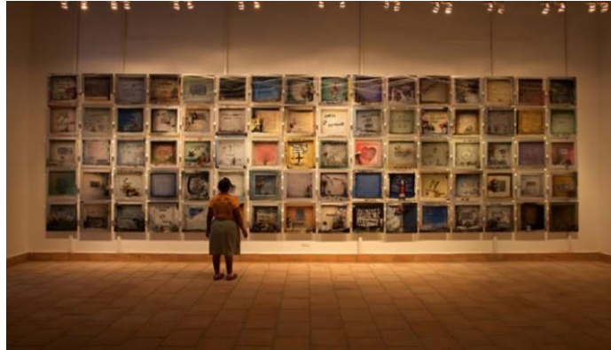
Figura 6. Requiem NN , Juan Manuel Echavarría (2013), Foto instalación.

El artista Llya Kabakov en entrevista con el escritor Boris Groys, habla sobre cómo la instalación debe ser pensada para el espectador, para ser recorrida, experimentada y analizada, dado que éste es el único que puede activarla: “es el amo de la instalación ya que puede viajar a través suyo”. Por lo tanto, en relación con la violencia, exponer una obra de instalación es llevar al público “una parte de la realidad”, es acercarlo al contexto artístico, generando así una experiencia de manera directa, y que cause un mayor impacto en el espectador (Kabakov y Groys, 1990, p.3).