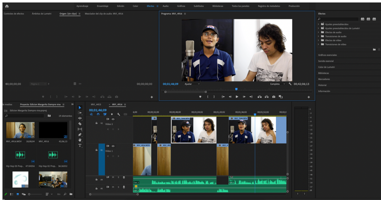
Figura 3. Edición y post producción del capítulo Margarita siempre viva.

Edición y post producción del capítulo Margarita siempre viva.