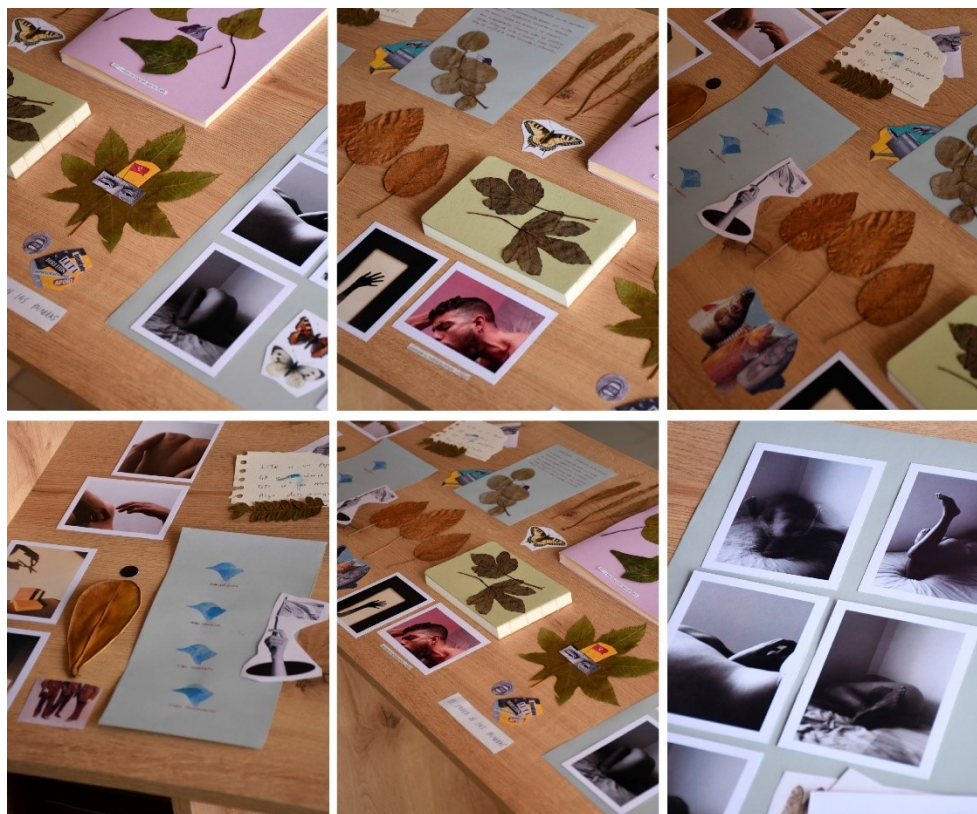
Imágenes 33-38. Materiales dispuestos y encontrados para la elaboración de los collages (2022). Fotografías, recortes, papeles, materiales orgánicos, palabras, colores, tintas, sellos. Jorge Andrés Serna Franco

Despertar la experiencia estética a partir de la fortuita o intencionada ordenación de materiales de desecho cotidianos, de pequeños fragmentos de las cosas que nos permiten la ensoñación de un mundo de belleza formal o un haz de ideas diversas; un arte, como cabe suponer, que trabaja las formas a partir de la experiencia arriesgada sobre materiales amorfos y, muchas veces, encontrados en algún momento de la cotidianidad en el taller (p. 76).