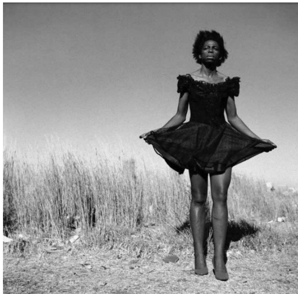
Imagen 9. Serie Beulahs, Miss D'vine II (2007). Fotografía. Zanele Muholi. Del Libro. Identidad y transgénero en la fotografía sudafricana: Zanele Muholi

La obra fotográfica de Zanele Muholi ha dado visibilidad a todas esas formas específicas de subjetividad atribuidas al género. La realidad es lo que sucede y las fotografías, como productoras de ideología, contribuyen a consolidar la experiencia no ya sólo como acontecimiento visual para una escritura de la historia sino también como una particular forma de mirar y entender dicha realidad. Se genera así un mecanismo que perfila un inconsciente mediante lo fotográfico (Ranedo, 2015, p. 57).