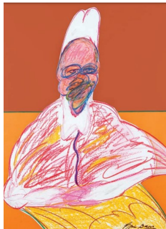
Imagen 7. Papa (1985). Pastel y collage sobre papel. 100 cm x 70 cm. Francis Bacon. Del libro. Francis Bacon La Cuestión Del Dibujo

Las pinturas de Bacon no representan nada sino la acción de ciertas fuerzas invisibles sobre el cuerpo. Las marcas involuntarias, aparentemente azarosas, del lienzo parecen solidarias con eso desconocido que pone en tensión un rostro o los músculos. Este arte no es un mero recipiente del dolor: en los cuadros se presenta más el grito que el horror (Círculo De Bellas Artes , 2017, p. 19).