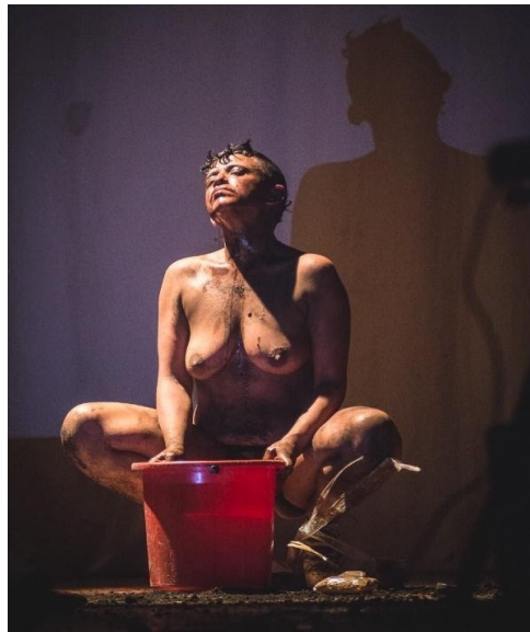
Imagen 1. Colombianización (2018). Performance. Nadia Granados. En línea. https://medium.com/brujulaalsur2018/colombianizacion-2ec4af975652

intereses y experiencias de vida que van ligados de una u otra manera a acciones políticas para dar más visibilidad y lucha a diversos temas que giran en torno a los estudios y teorías Queer. La artista ha dirigido algunos laboratorios de creación de cabaret, los cuales se centran en la discusión de la violencia de género, y en los que han participado colectivos de mujeres y comunidades queer.