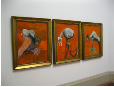
Imagen 6. Tres estudios para figuras en la base de una crucifixión (1944). Pintura al óleo, Pastel. Francis Bacon. En línea. https://escargotazul.wordpress.com/tag/tres-estudios-para-figuras-en-la-base-de-una-crucifixion/

El artista representa en sus obras, un entramado de emociones y sentimientos que va liberando a medida que experimenta y crea, tal y como lo expresan todas sus pinturas en este caso su forma de abordar en esta obra el cuerpo.