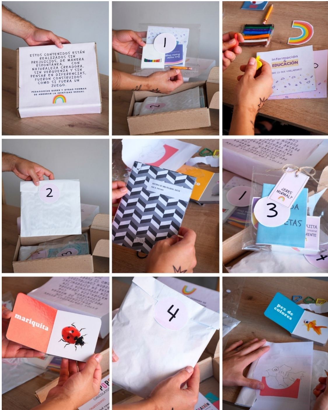
Imágenes 15 – 23. Pedagogías Queer y Nuevas Formas De Abordar La identidad Sexual (2020). Kit pedagógico Medellín: Museo y Pedagógica. Jorge Andrés Serna Franco