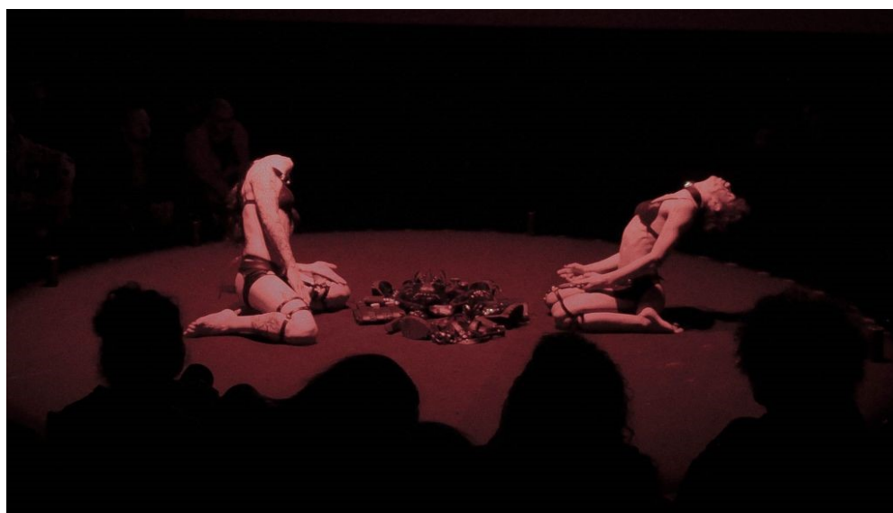
Imagen 14. Eunuca Posporno - Óbito Travesti (2019). Bogotá: 45 Salón Nacional de artistas. Performance. Analú Laferal. En Línea. https://portaleror1913.com/2020/02/24/el-cuerpo-es-un-territorio-en-disputa/

Me di cuenta que el cine era una posibilidad para explorar los tránsitos, porque daba la oportunidad de pensar tanto el diálogo, como la imagen. En un primer momento no lo tomé como investigación académica sino como algo personal; me causó mucha curiosidad saber qué estaba pasando en el cine latinoamericano respecto a este tema. Coincidentalmente, en ese entonces estaba cursando la maestría y creí oportuno volver este tema el centro de mi investigación (Salazar, párr. 2).