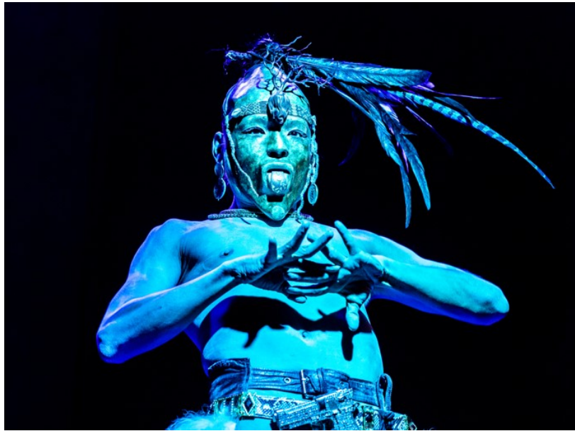
Imagen 10. No soy persona, soy mariposa (2018) . Performance. Lukas Avendaño. En Línea. https://radiococoa.com/RC/lukas-avendano-una-apuesta-por-las-utopias-y-lo-inimaginable/

Lukas Avendaño (1977) es un artista y antropólogo muxe del istmo de Tehuantepec en Oaxaca, México. En su obra explora la idea de identidad sexual, de género y étnica a través de la muxeidad. Avendaño describe la muxeidad como “un hecho social total” llevado a cabo por personas nacidas biológicamente como hombres pero que tienen papeles sociales considerados no masculinos (Palacios, s. f., párr. 1).