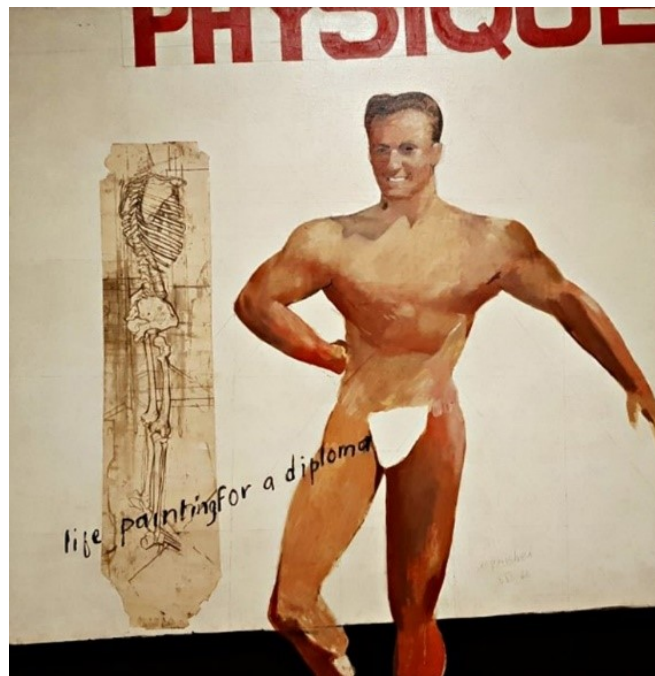
Imagen 8. Life painting for a diploma (1962). Óleo Sobre lienzo en carboncillo sobre papel. 70 cm x 70 cm. David Hockney. En Línea. https://www.thedavidhockneyfoundation.org/artwork/3589

Su motivadora obra habla de la plástica de la sexualidad, ya que notoriamente se ha evidenciado en ella, que el artista quiso reflejar las relaciones sentimentales/sexuales entre personajes masculinos.