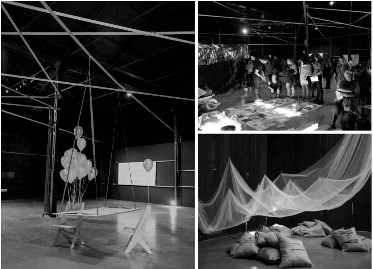
Imagen 2 - 4. Exposición nave 16 de Matadero Madrid. (2015 – 2016). Grupo de Educación de Matadero Madrid. Del Libro. Ni arte ni educación: Una experiencia en la que lo pedagógico vertebra lo artístico

La exposición pretendió acoger lo público y lo privado, lo personal y lo político, así como promover la ciudadanía crítica y la diversidad. Por lo tanto, la propuesta de GED adquirió sentido con la participación del público que habitó la exposición. Los instantes que se muestran a continuación, más que ilustrar, insinúan la relación entre el espacio, los dispositivos y las personas que se implicaron (Madrid, 2017, p. 207).