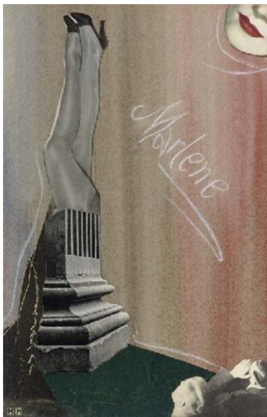
Imagen 5. Marlene (1930). acuarela, pastel blanco y collage de papel sobre papel verjurado sobre papel. Hannah Höch.

Igualmente, Francis Bacon (1909) es un artista importante que vivió abiertamente su homosexualidad antes de que esta se legalizara en el Reino Unido en 1967, fue destacado y considerado como uno de los pintores más relevantes de la posguerra a partir de su famosa obra Tres estudios para figuras en la base de una crucifixión (1944), esta obra, según explican los expertos del museo de La Tate Britain de Londres, simboliza la asociación entre la maldad, la monstruosidad y el nazismo (El Escargot Azul, 2014, párr. 3).