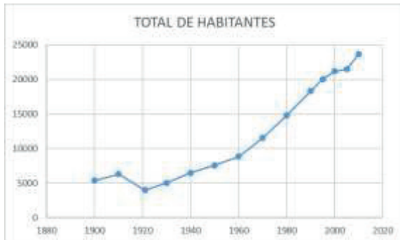
Figura 2. Crecimiento en número de la población de Comonfort (1900 – 2010)

En cuanto al crecimiento de su población, el municipio de Comonfort ha casi que quintuplicado su crecimiento del año 1900 al 2010 (Fig. 2).