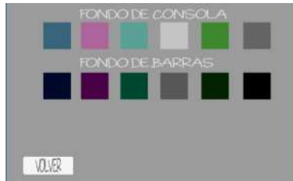
Figura 4. Ventana de ayuda Buscar Canción

La figura 4 muestra la ventana de configuración en la cual el usuario puede personalizar los controles y el fondo de la ventana principal o mixer.