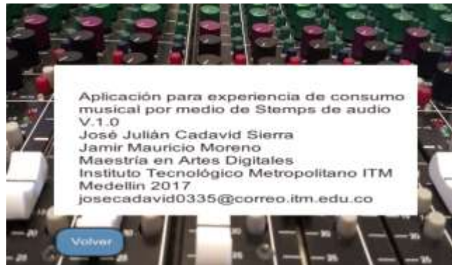
Figura 3. Ventana de ayuda Buscar Canción

La figura 3 muestra la ventana de ayuda, la cual, muestra información básica de la aplicación: