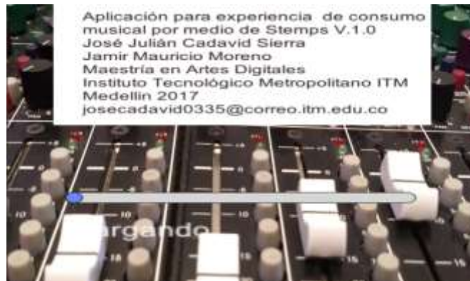
Figura 1: Ventana de inicio

Dicha ventana, pasará automáticamente a la ventana siguiente luego de algunos segundos.