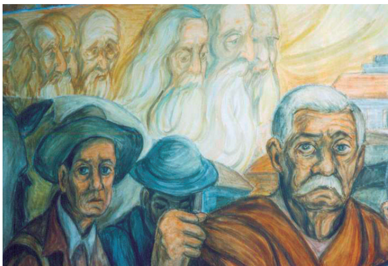
Fotografía 5. Mural al fresco Alegoría de Antioquia . Dimensiones: 1.00 x 4.00 m