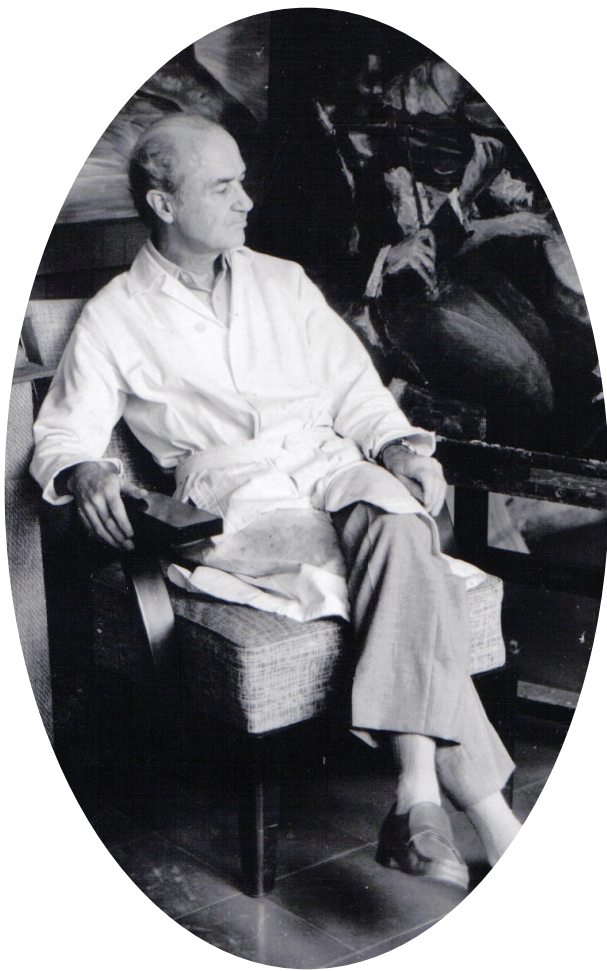
Maestro León Posada Saldarriaga