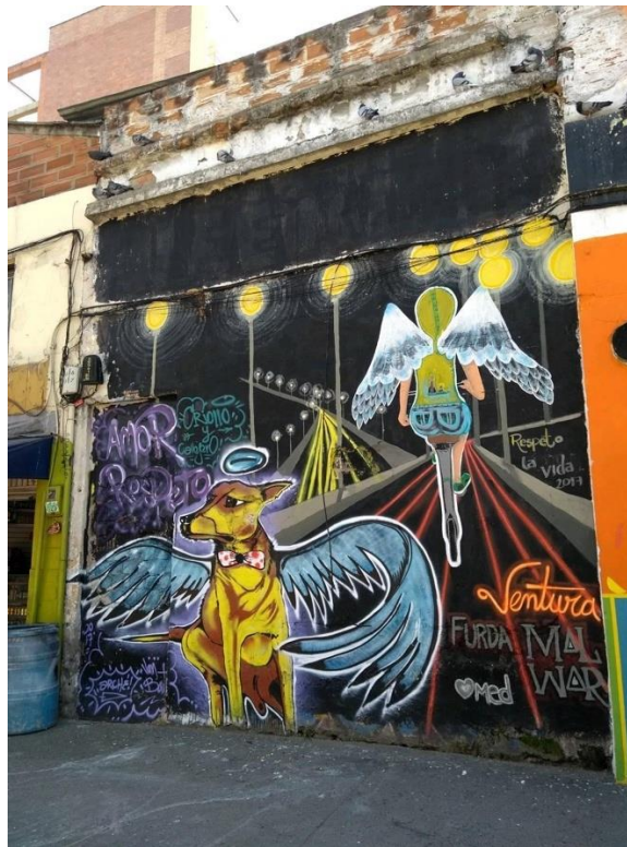
Ilustración 4 Ángel con cola, detalle.

Como mensaje manifiesto se percibe que se quiere incentivar el respeto y el amor por los seres vivos, tanto para los animales como por las personas. En la composición ello está representado en un perro con alas y la figura femenina que pedalea la bicicleta. El mensaje latente es que un perro es más que un animal, son nuestros compañeros de viaje, de vida, nuestros guardianes, son compañía para todos en el plano terrenal, y en el plano divino se consideran “ángeles con cola”, pues enseñan sobre el amor, la lealtad, el cariño y la compañía.