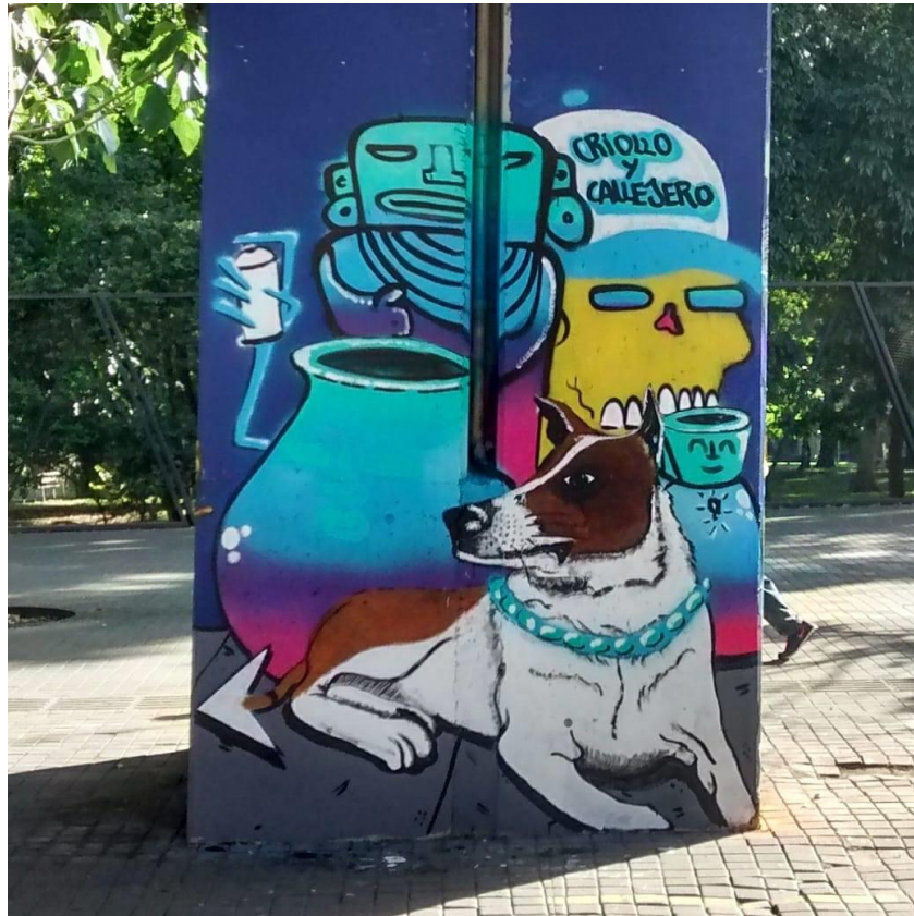
Ilustración 5 Guardián (2017). De la serie "Criollo y Callejero (intervención mural urbana) 3 m x 1 m. Sector Jardín Botánico de Medellín, Felipe VanBart.