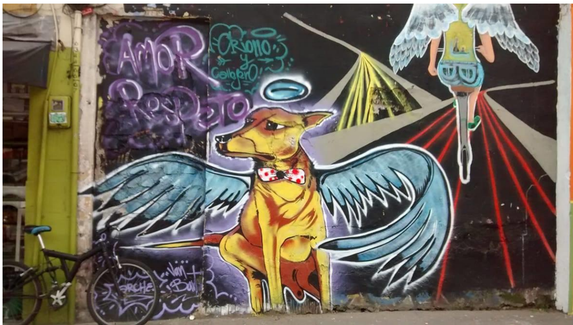
Ilustración 3 Ángel con cola (2017). De la serie "Criollo y callejero" (Intervención mural urbana) 5 m x 2 m., Calle 44 con Carrera 76, Felipe Espinosa y Laura Ojeda

Este mural fue pintado con el fin de resignificar el espacio por medio de la pintura y el color con un tema de reflexión frente al amor y el respeto por la vida representado en los perros callejeros desamparados e indefensos que son para lo humano sus “ángeles con colita”. Esta intervención visual está dentro de lo que se conoce como arte urbano o Street Art .