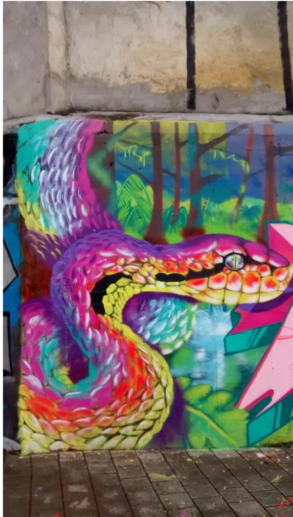
Ilustración 9 Iuma, Serpiente arco iris (2018). De la serie "Tropical Andino" (intervención mural urbana) 4 m x 5 m. Sector Estación Hospital, Felipe VanBart.