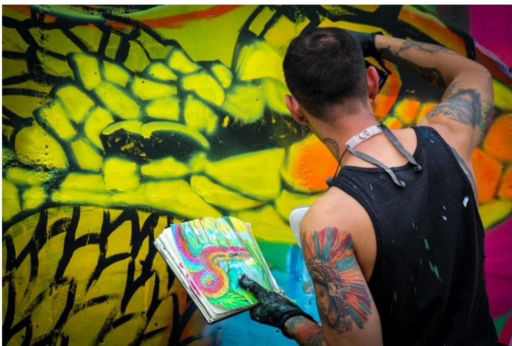
Ilustración 8 luma, serpiente arco iris . Detalle

Este mural se pintó con el fin de enaltecer las culturas indígenas y reivindicar la ancestralidad y las raíces indígenas de Colombia. Esta intervención visual se encuentra dentro de los que conocemos como arte urbano o Street Art.