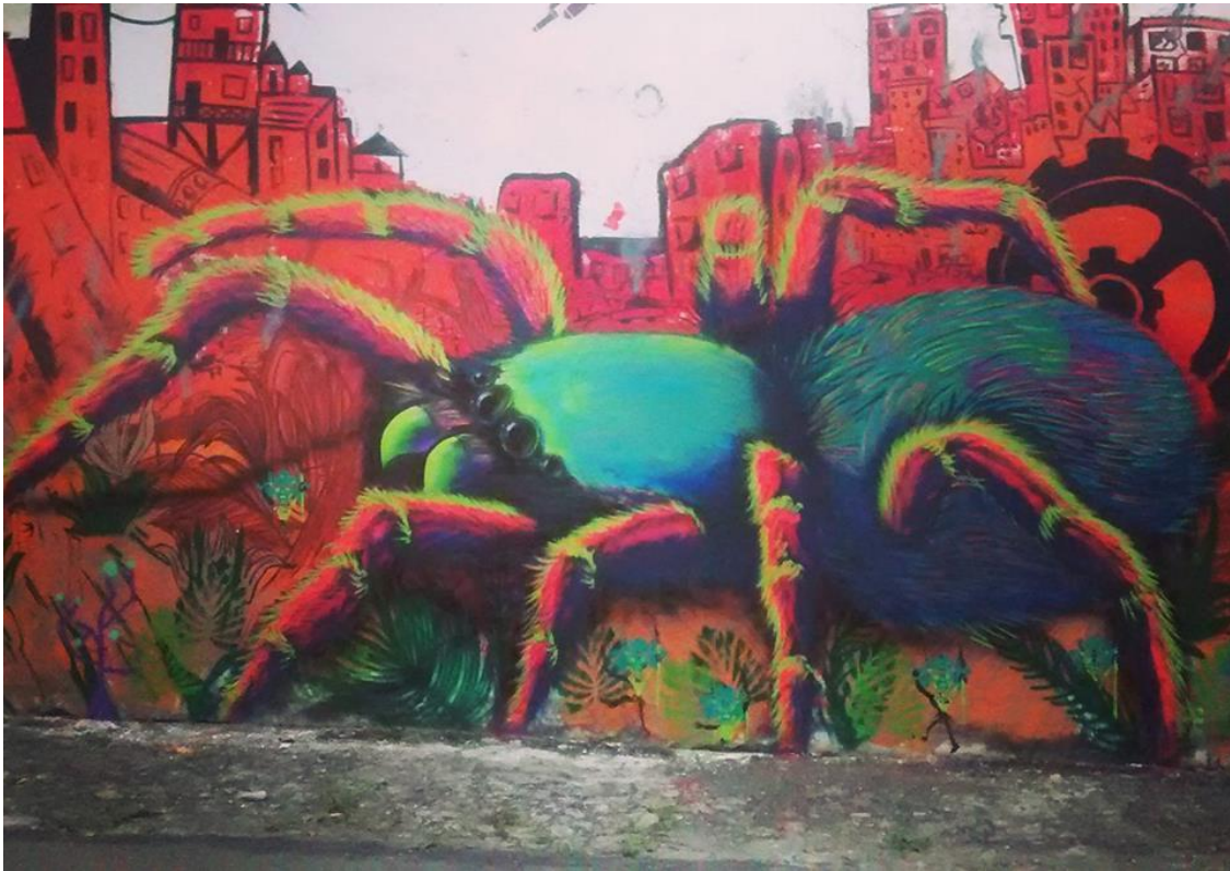
Ilustración 7 Arachne y Caos (2016). (Intervención mural urbana) 7 m x 4 m. Barrio La Floresta, Medellín, Felipe VanBart.

El mensaje manifiesto de esta obra mural es la destrucción de una ciudad por el paso de una gran araña que derriba los edificios con su caminar. El mensaje latente es el sentido contracultural desde la representación estética de pintar insectos en vez de pájaros y flores como los solicita la administración en proyectos para la resignificación de espacios de la ciudad.