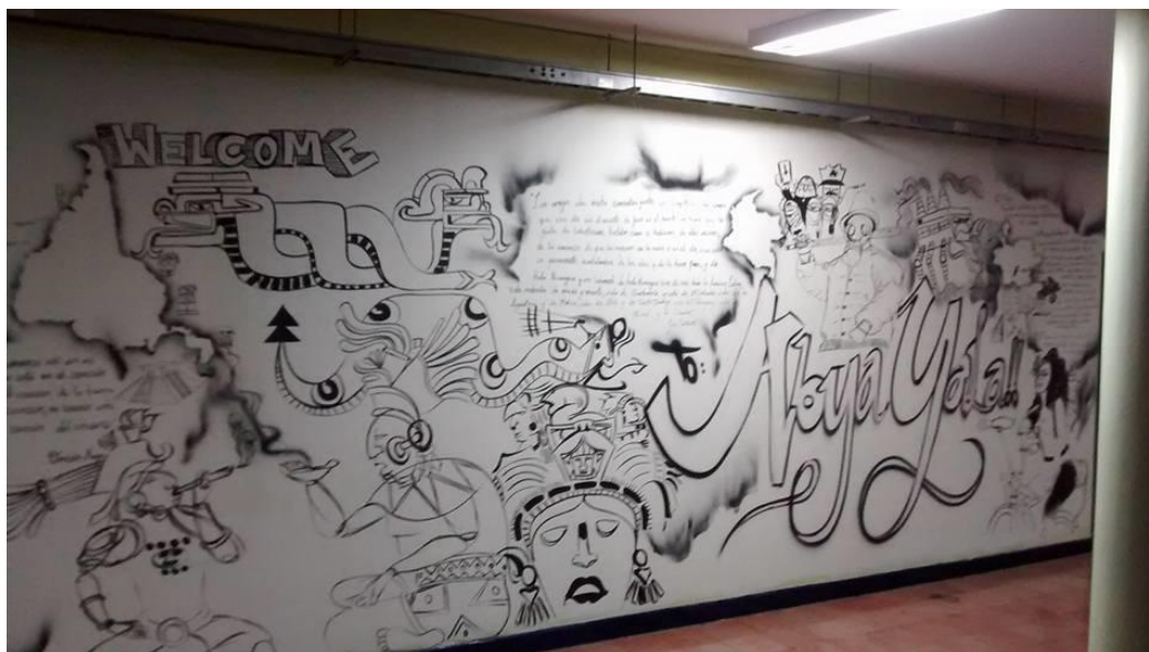
Ilustración 1 Detalle

Este mural se pintó como producto y entrega final del curso “Propuesta artística” del programa académico Maestro en Artes Visuales con el propósito de enaltecer las culturas indígenas, reivindicar la ancestralidad, la identidad como latinoamericanos, el sincretismo con las culturas de occidente y las culturas urbanas. Esta intervención visual se encuentra dentro de la categoría que conocemos como Neo Muralismo.