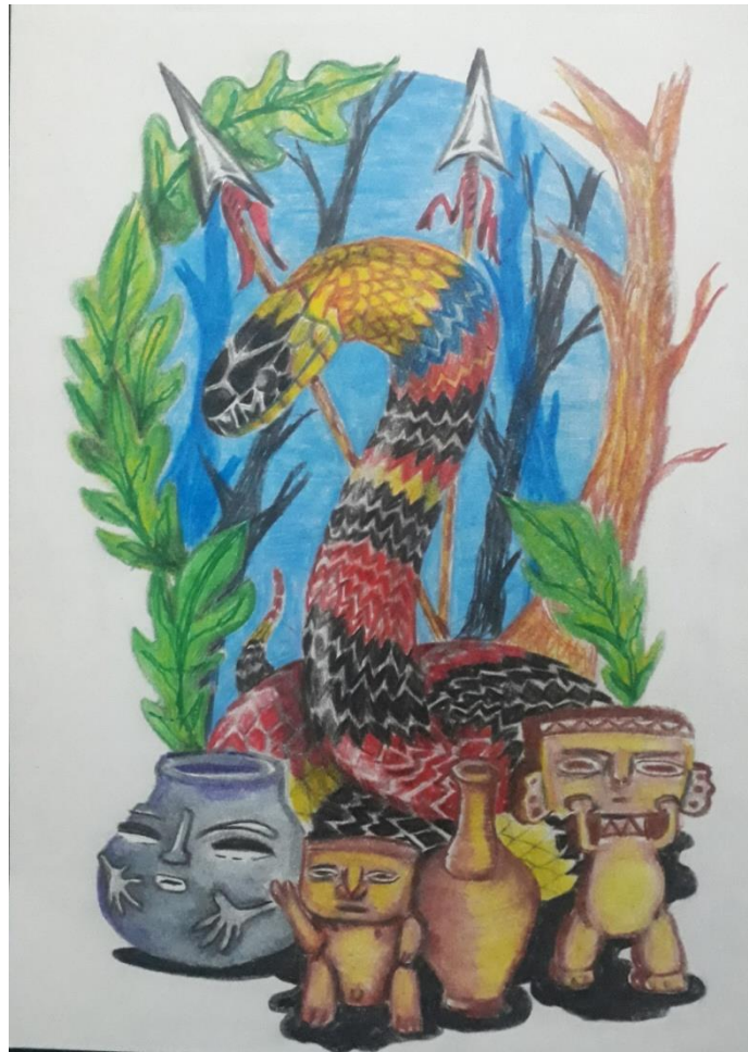
Ilustración 12 Inmigrante Latino. Boceto