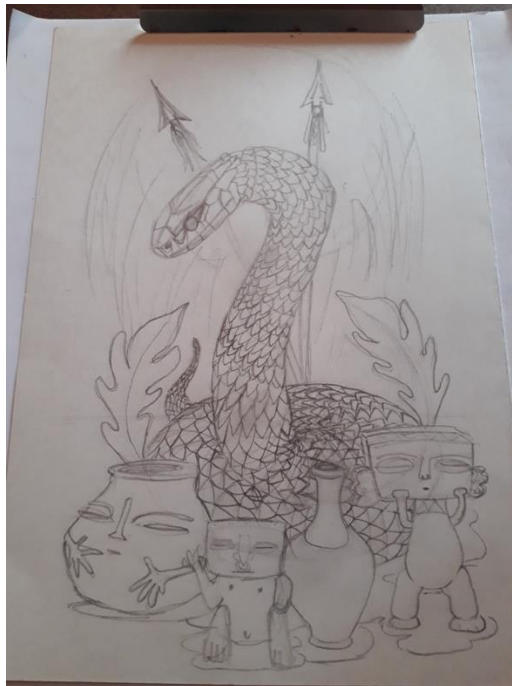
Ilustración 10 Proceso de Boceto.

Esta intervención visual está dentro de lo que se conoce como Neo Muralismo.