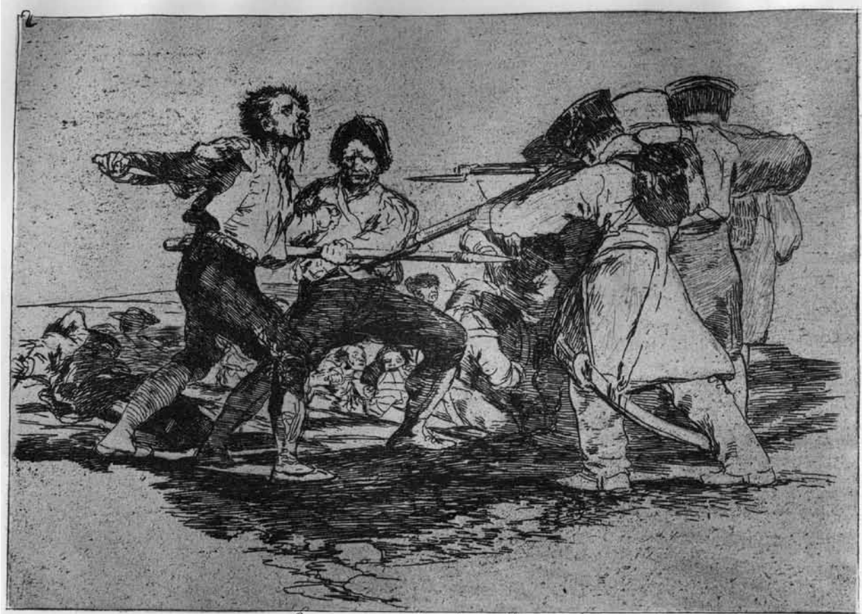
Con razon ó sin ella.