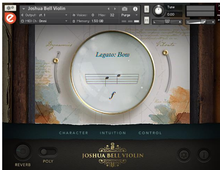
Figura 36. Joshua Bell Violin

Asimismo, se buscaron otras opciones para los violines; no obstante, se decidió utilizar el instrumento virtual Joshua Bell Violin, donde la sonoridad de los violines se sentía limpia y con dinámicas precisas (Figura 36).