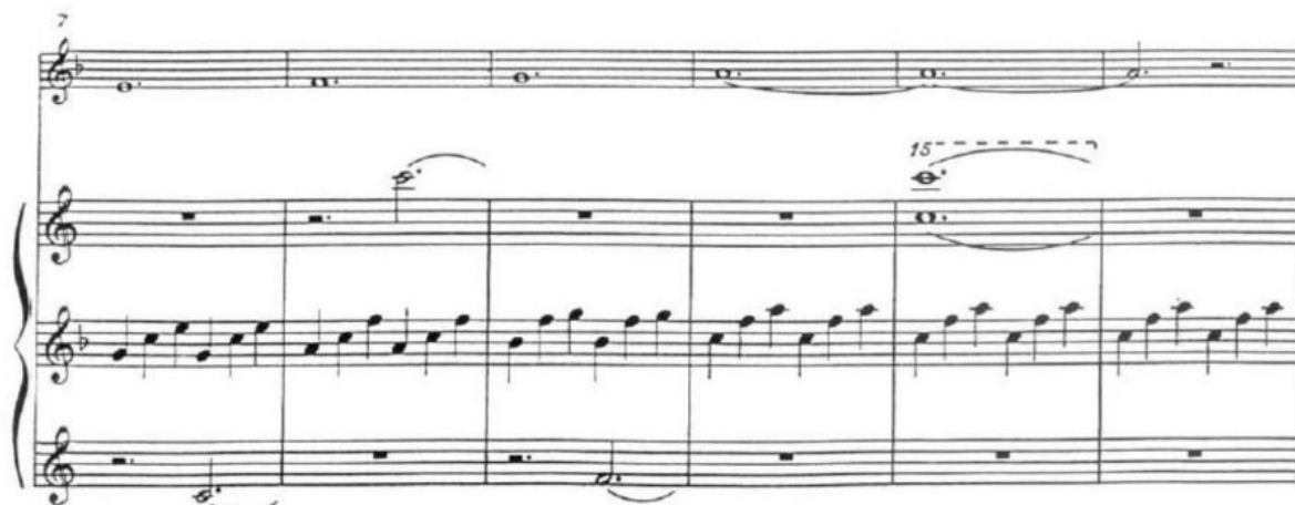
Figura 12. Spiegel im Spiegel de Arvo Pärt

Nota. Cc. 7-12. Fragmento de la partitura de Spiegel im Spiegel de Arvo Pärt.