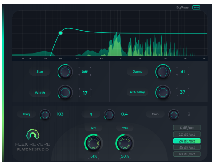
Figura 40. Platone Studio Flex Reverb

En suma, se utilizó un plug in de reverberación igual para todos los instrumentos con el objetivo de hacerle creer al oyente que cada instrumento pertenece a un mismo entorno. El plug in elegido para este proceso fue el Platone Studio Flex Reverb, cuyos parámetros modificados fueron los siguientes: el size se puso en 59 para simular un espacio abierto, como un teatro. El width se ajustó a 17 junto con el pre-delay en 37, para simular un poco de lejanía, pero algo focalizada en los instrumentos. Finalmente, el damp se puso en 81 para que los brillos se atenuaran rápidamente y no estorbaran a los demás instrumentos (Figura 40). Estos parámetros no son iguales para todos los instrumentos, porque cada voz es diferente en su espectro.