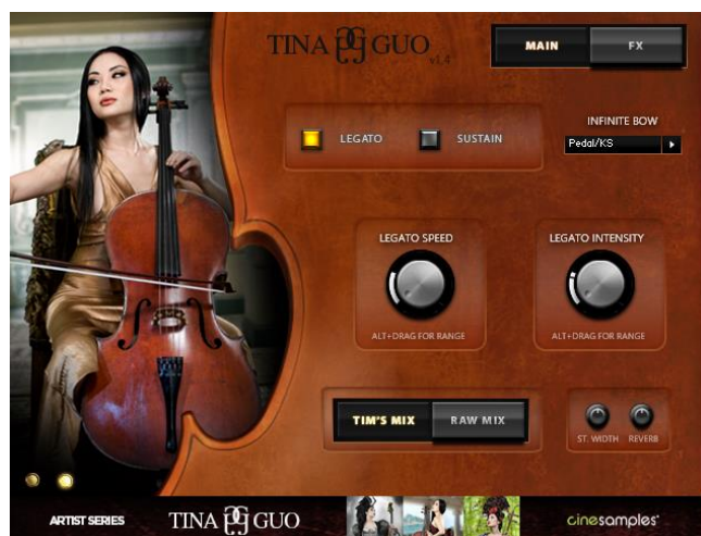
Figura 37. As Tina Guo Legato

Al momento de la importación de los MIDI a estos instrumentos plug in , salieron a la luz varios problemas: a) las dinámicas, que no eran del todo correctas, por lo que no había fidelidad con respecto a lo escrito en la partitura; por ejemplo, los Forte no sonaban como la dinámica sugería, sino sin fuerza, o no llegaban a modular su nivel sonoro cuando llegaba el momento. b) Al tener tres instrumentos virtuales distintos, la interpretación y la sonoridad de las notas y dinámicas eran diferentes, por lo que la unión de estos instrumentos no sonaba homogénea. c) Cuando las melodías llevaban notas rápidas, como corcheas o semicorcheas, el instrumento virtual no podía interpretarlas de manera correcta, y la entrada de las notas no coincidía, más bien sonaba un pequeño eco que se perdía rápidamente con la entrada de la siguiente nota. d) Había un problema con algunos adornos, más específicamente, los trinos: aunque estos instrumentos virtuales están hechos para interpretar lo que la partitura recomienda, no siempre tienen la mejor sonoridad; por