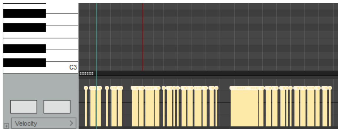
Figura 38. Todas las dinámicas del instrumento virtual al mismo nivel

En segundo lugar, con un EQ se intentó dar a la viola una sonoridad parecida a la de los violines junto a la viola, a fin de conseguir una presentación homogénea; ello, al ver las frecuencias más presentes en cada uno de los instrumentos. Al respecto, se evidenció que, en los violines, las frecuencias más presentes eran los medios y sus armónicos más agudos, por lo que para la viola se tomó la decisión de realzar un poco estas frecuencias medias y altas (de 500Hz en adelante). Asimismo, en los violines, se cortaron un poco las frecuencias altas para dar una sonoridad menos brillante, de forma que estas se parecieran a la sensación que brindaba la viola. En la siguiente Figura 39 se observa el EQ de la viola; además, se aprecia que las frecuencias alrededor de los