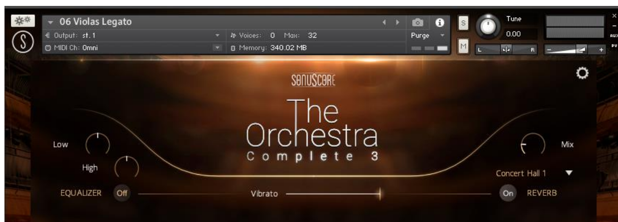
Figura 35. The Orchestra Complete

Asimismo, se buscaron otras opciones para los violines; no obstante, se decidió utilizar el instrumento virtual Joshua Bell Violin, donde la sonoridad de los violines se sentía limpia y con dinámicas precisas (Figura 36).