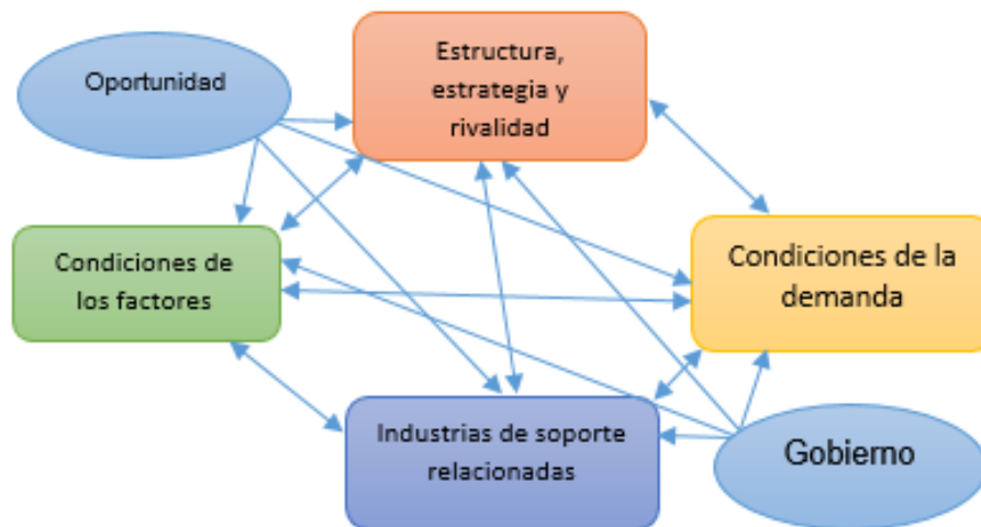
Figura 1. Modelo del Diamante de Porter

Según Kramer y Porter (2006) y Erboz (2020), a largo plazo la productividad nacional será el principal determinante del estándar de vida de un país. De acuerdo con esto, según Porter, no se puede desconocer lo que se observa en la Figura 1.