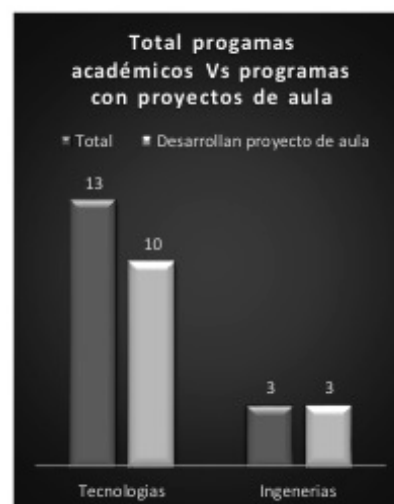
Figura 3. Total programas académicos versus programas con proyectos de aula