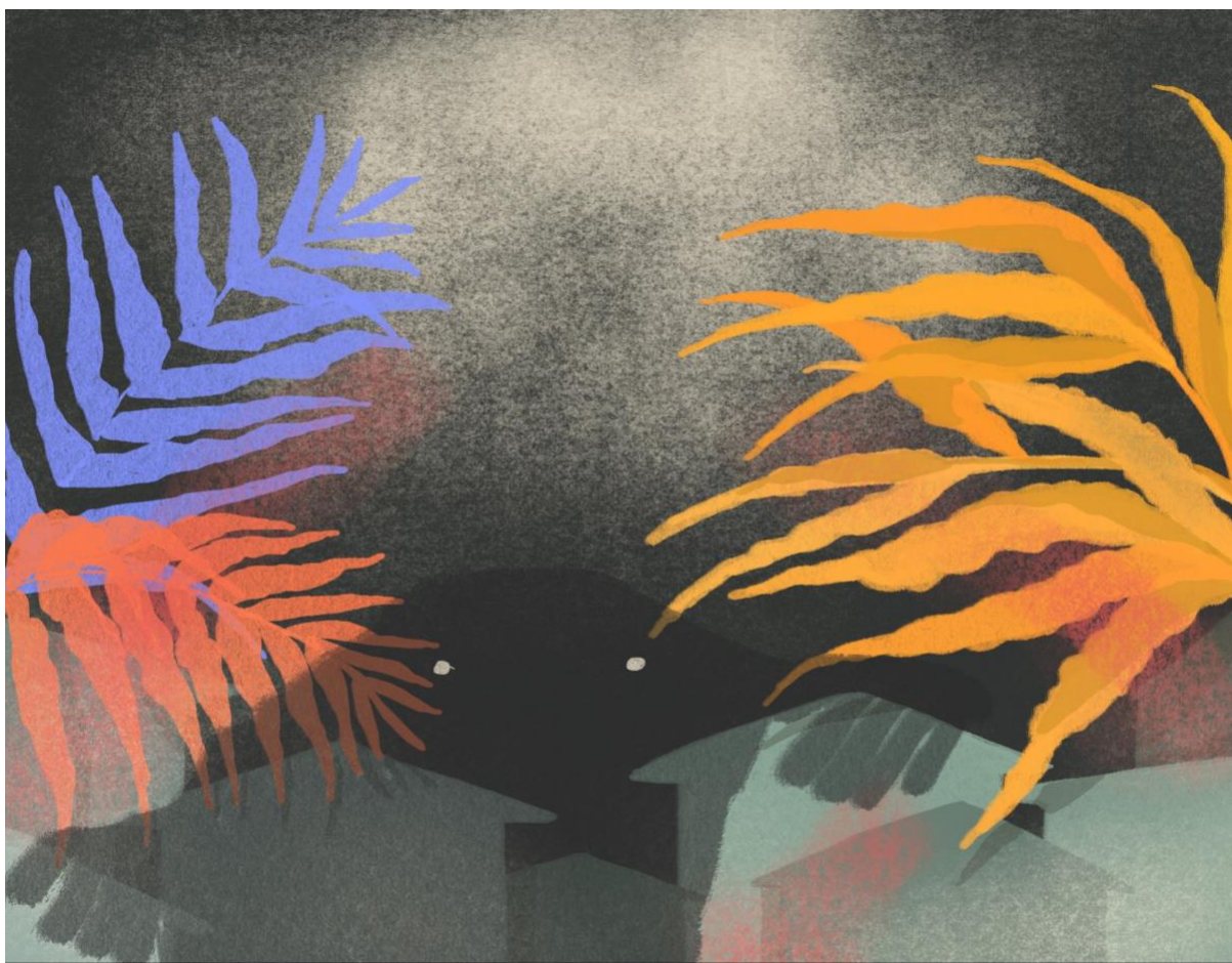
Ilustración 3. Boceto preliminar para la creación del libro ilustrado para público infantil Hay monstruos en mi pueblo , proyecto ganador de la beca de creación de obra literaria ilustrada para público infantil del Museo Casa de la Memoria y la Secretaría Cultura Ciudadana de Medellín - 2021.