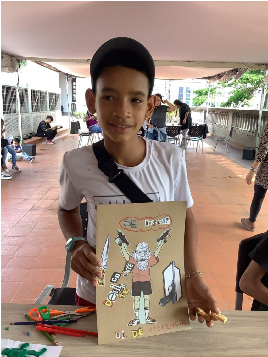
Fotografía 1. Tercer Laboratorio creativo para la construcción de paz y memoria del Proyecto Hay Monstruos en mi pueblo, 2021. Co-creación de carteles de “SE BUSCA”.