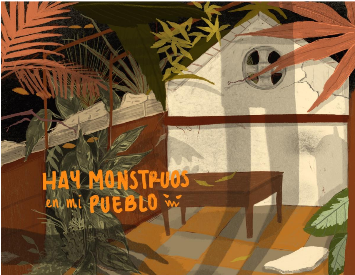
Ilustración 1. Portada del libro ilustrado para público infantil Hay monstruos en mi pueblo , proyecto ganador de la beca de creación de obra literaria ilustrada para público infantil del Museo Casa de la Memoria y la Secretaría Cultura Ciudadana de Medellín - 2021

Centro Nacional de Memoria Histórica (2013)