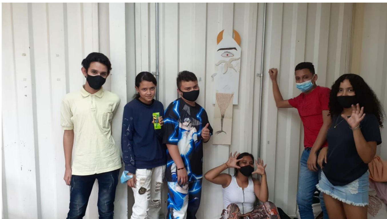
Fotografía 2. Primer Laboratorio creativo para la construcción de paz y memoria del Proyecto Hay monstruos en mi pueblo , 2021. Creación colectiva del Coloso del conflicto .

Los principios pedagógicos para el desarrollo de las sesiones del Laboratorio Creativo para la construcción de paz y memoria estuvieron respaldados por el modelo pedagógico adoptado por la Fundación Centro Internacional de Educación y Desarrollo Social (CINDE), para la construcción y desarrollo de procesos comunitarios a través de la inmersión en las pedagogías para la paz. Estos principios posibilitan el reconocimiento y valor del otro, potencian la autonomía, el empoderamiento y el trabajo en equipo.