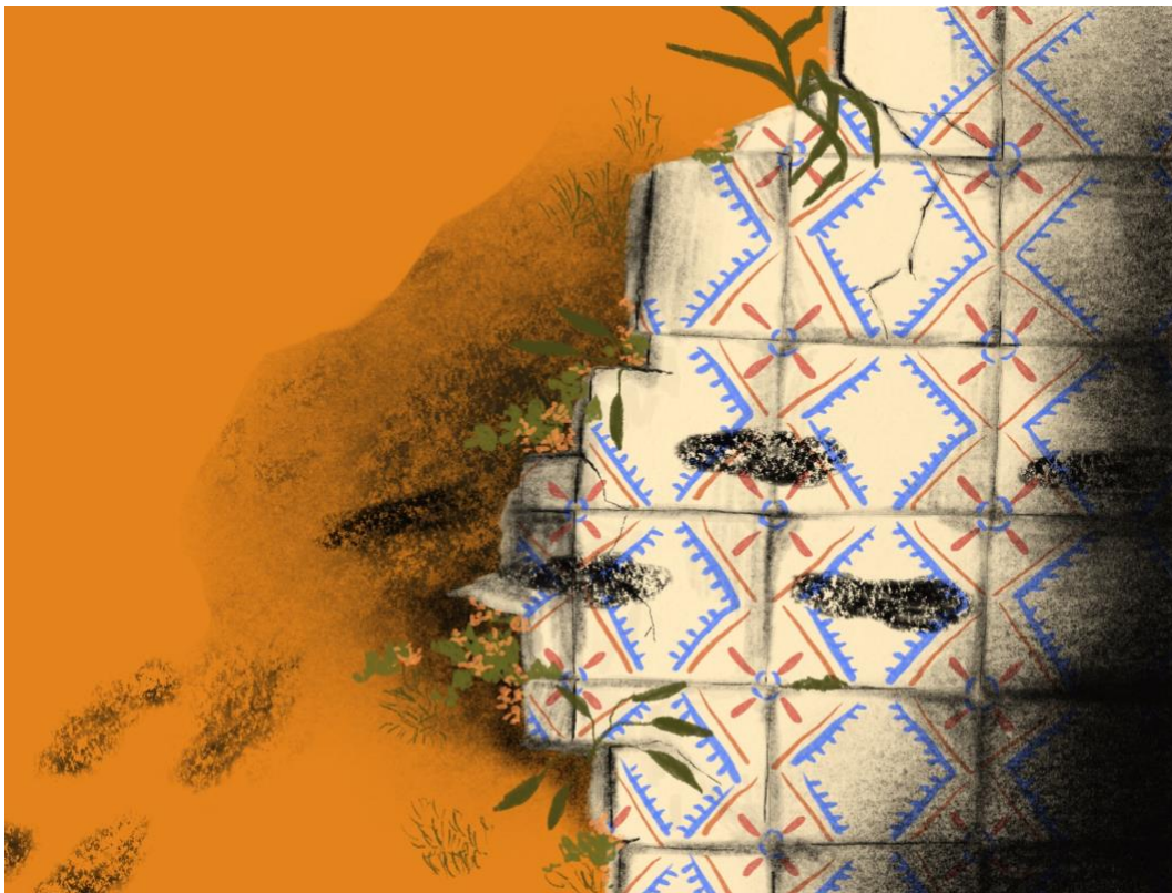
Ilustración 2. Ilustración interior del libro ilustrado para público infantil Hay monstruos en mi pueblo , proyecto ganador de la beca de creación de obra literaria ilustrada para público infantil del Museo Casa de la Memoria y la Secretaría Cultura Ciudadana de Medellín - 2021.