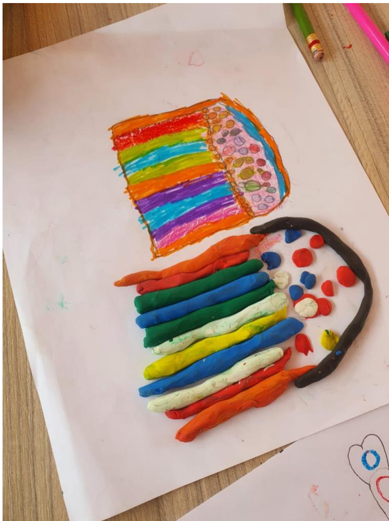
Fotografía 4. Cuarto Laboratorio Creativo para la Memoria del Proyecto Hay Monstruos en mi pueblo, 2021. Co-creación de máquinas para no olvidar.

Nos despedimos, comiendo torta de chocolate y jugo; jugando, riendo y cantando; con muchos anhelos de volvernos a encontrar para crear juntos.