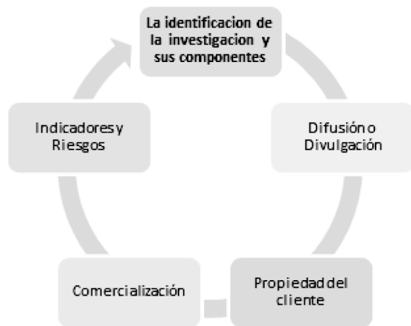
Gráfico 1. Estructura del modelo de sistematización de introducción de resultados de investigación

dirigirse, y hace parte de la gestión educativa que concierne a directivos, profesores que lideran el proceso, y muy especialmente a los investigadores.